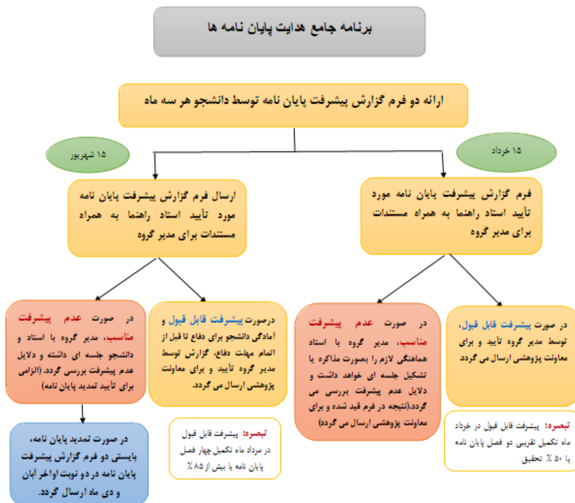
شکل ۳- برنامه جامع هدایت پایان نامه

فرم های ارزشیابی پیشرفت پایان نامه (FTR40) به منظور هدایت بهتر پایان نامه ها و افزایش ارتباط دانشجویان و اساتید راهنما، در دو مرحله توسط دانشجو تکمیل و بعد از تأیید استاد راهنما و مدیر گروه برای معاونت پژوهشی ارسال می گردد. فرم های تکمیل شده حداکثر در دو زمان ۱۵ خرداد و ۱۵ شهریور بایستی برای معاونت پژوهشی ارسال شود. فرم ها توسط مدیر گروه به ایمیل پژوهش ro@mehrabborz.ac.ir بایستی ارسال گردد. در صورتیکه روند پیشرفت پایان نامه در هر یک از دو مرحله مطابق شکل ۳ قابل قبول نباشد بایستی توسط استاد راهنما و مدیر گروه، دلایل عدم پیشرفت بررسی و به اطلاع معاونت پژوهشی رسانده شود. همچنین اگر در صورت عدم پیشرفت پایان نامه تا ۱۵ شهریور، مدیر گروه با حضور استاد راهنما و دانشجو، طی جلسه ای دلایل و موانع پیشرفت پایان نامه بررسی و به صورت مکتوب همراه با تأیید تمدید پایان نامه به آموزش و معاونت پژوهشی ارسال می گردد.