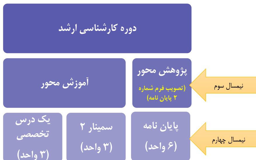
شکل ۱- تفاوت دانشجویان پژوهش محور و آموزش محور