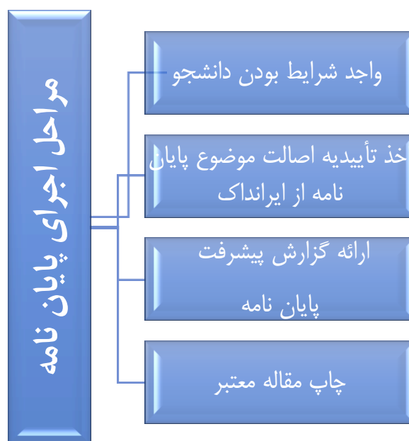
شکل ۲- مراحل اجرای پایان نامه

همچنین فرآیند اجرای پایان نامه شامل مراحل است که در شکل ۲ به آن اشاره شده است.