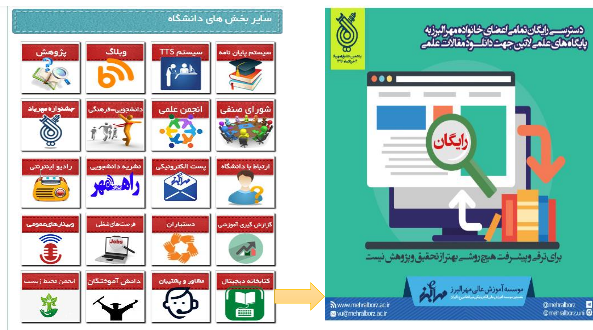
شکل ۴- دسترسی به راهنمای ثبت نام در کتابخانه دیجیتال مؤسسه در پرتال